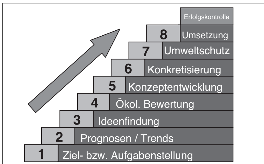
Abbildung 2.: Schritte einer professionellen Produktentwicklung unter Einbezug ökologischer Aspekte

tungsangeboten für Klein- und Mittlere Betriebe geschaffen werden. Derzeit noch aktive Beratungseinrichtungen in Deutschland sind zum Beispiel die Effizienzagentur in Duisburg ( www.efanrw.de/ ) und die Deutsche Materialeffizienzagentur in Berlin ( www.Materialeffizienzagentur.de ). Auf den Internetseiten von www.pius-info.de liegen beispielsweise Branchenkonzepte zum Download bereit, wie für das Druckereigewerbe, der Kfz-Reparatur, der Metallverarbeitung und des Gesundheitswesens.