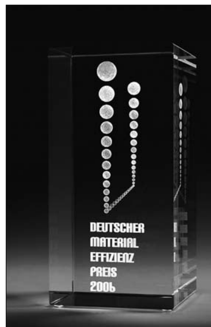
Abbildung 3: Deutscher Materialeffizienzpreis 2006

Um beurteilen zu können, welche Abfallgruppen die besten Ansatzstellen für Maßnahmen der Abfallvermeidung darstellen, muss geprüft werden, mit welchen Abfallgruppen hohe Umweltbelastungen verbunden sind. Eine Datengrundlage bilden die Abfälle, die der Beseitigung zugeführt werden, aber auch die Abfälle, die verwertet werden. Denn auch für die Abfälle, die der Verwertung zugeführt werden, sind während der Herstellung, der Nutzung und der Abfallverwertung Umweltbelastungen entstanden, die durch die Verwertung weder vermieden noch reduziert werden. Erst eine