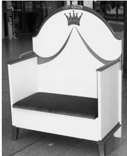
Abbildung 4: Ein ecomoebel -Produkt. Die „Princess-Bank“, war einmal ein altes Bett (in das keine heutige Matratze mehr passen würde) und wurde zu einer Bank umgebaut. Die Sitzfläche ist gepolstert und mit Samt bezogen (wie für eine Prinzessin) und lässt sich hochklappen.

Um die hier angesprochenen neuen Nutzungskonzepte aus der Nischenexistenz herauszubringen, könnten einige ökonomische Veränderungen hilfreich sein. Zum einen wäre eine Umverteilung von direkten und indirekten Förderungen, die derzeit in nicht-nachhaltige Wirtschaftsstrukturen geleitet werden, zu Gunsten nachhaltiger Unternehmen sinnvoll. Auch das internationale Wettbewerbsrecht sollte angepasst werden und die Preispolitik sowie die Bemessungsgrundlagen von Steuern und Sozialabgaben sollten auf das Arbeitseinkommen ausgerichtet sein. Parallel sollten die Produktnutzungskonzepte marktgerecht gestaltet und für den Kundenkreis ansprechend kommuniziert werden. Dabei ist zu bedenken, dass