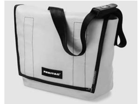
Abbildung 3: Freitag-Tasche

gemacht werden kann. Ein solches Objekt stellt zum Beispiel der mehrere meterhohe Quarder aus zusammengequetschten Getränkedosen dar, der im Foyer eines renommierten Einkaufszentrums an der Berliner Friedrichstraße steht. Auch die zahlreichen Workshops zur Gestaltung von Schmuck oder dekorativen Objekten aus Blech zeugen von einem neuen Interesse an alten Materialien, so auch das altbekannte Patchwork von Textilien.