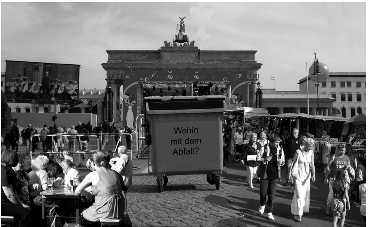
Bild 1: Straßenfest vor dem Brandenburger Tor in Berlin (Fotomontage)

Die geschätzte Abfallmenge, die durch öffentliche Veranstaltungen in Berlin entsteht, ergibt ein Aufkommen von circa 1.600 Tonnen pro Jahr. Im Verhältnis zu den Siedlungsabfällen, von denen in Berlin jährlich etwa 1,4 Millionen Tonnen anfallen – einschließlich der getrennt erfassten Wertstoffe von circa 400.000 Tonnen [Amt für Statistik 2010] – macht die Menge an Veranstaltungsabfall schätzungsweise 0,1 Prozent aus.